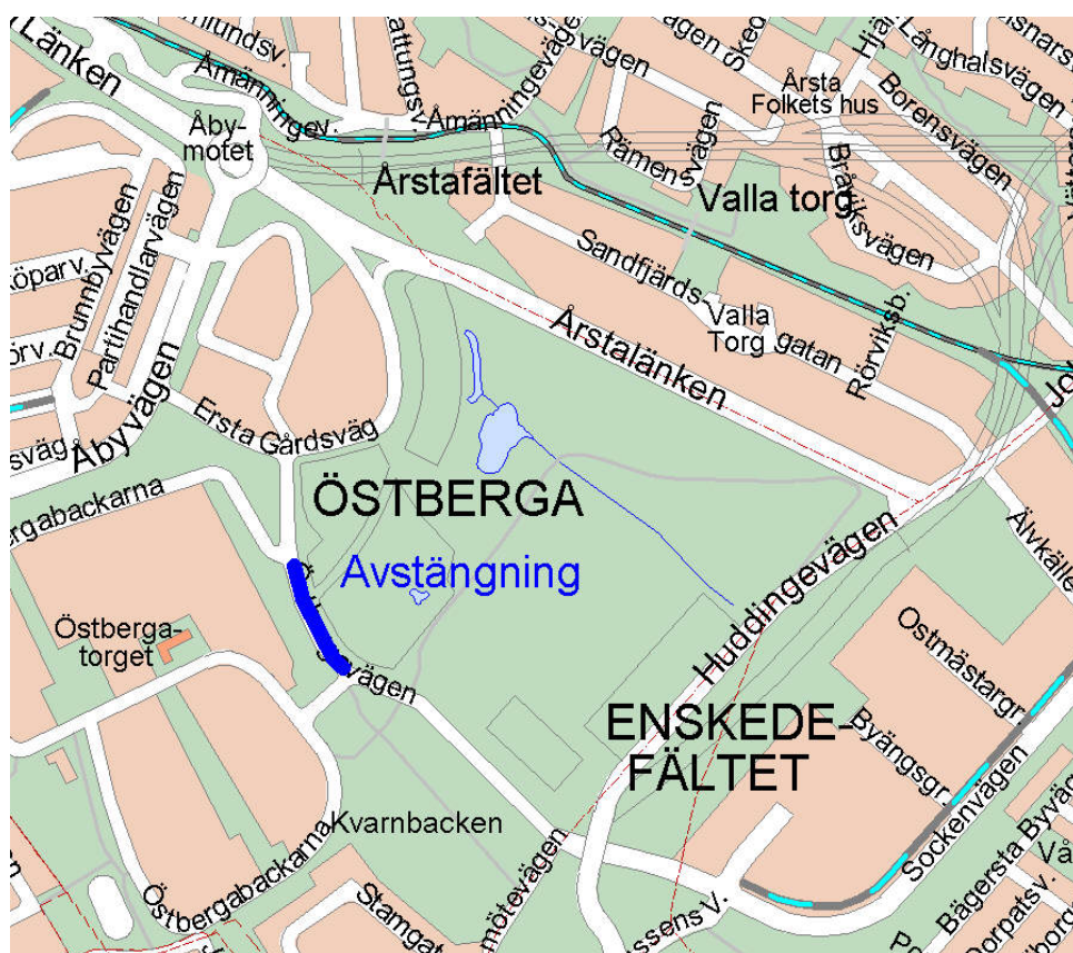
Kompromissförslaget – Östbergavägen stängd mellan anslutningarna till Östbergabackarna

På grund av den starka opinionen, främst i Gamla Östberga och Örby Slott, togs ett ”kompomissförslag” fram, se bild nedan. I detta förslag stängs Östbergavägen av mellan infarterna till Östbergabackarna. Det var också detta förslag som sedan fastlades i detaljplanen för Årstafältet, Dp 93045, vilken antogs av fullmäktige 2000-10-30, bilaga 2.