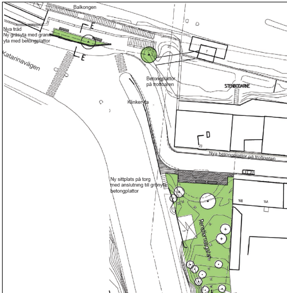
Skiss över balkongen på Katarinavägen och parken vid vändplanen

Här föreslås en mer ordnad grönyta med tydliga kanter. En stödmur ska skydda mot trafiken och ta upp nivåskillnader. Ett stort träd föreslås planteras på platsen för att få en grön avslutning av Renstiernas gata.