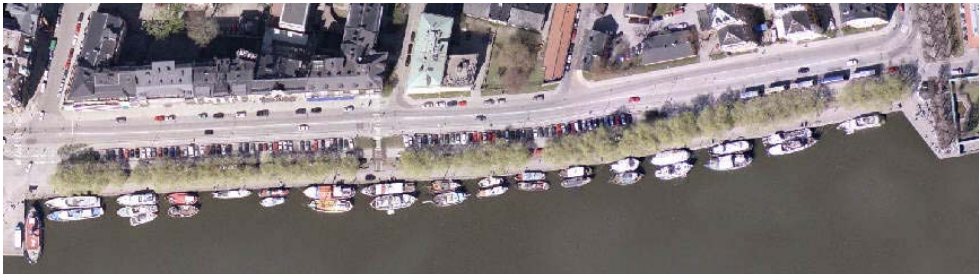
Figur Ortofoto över aktuell sträcka

I samband med programarbetet konstaterades att en del av kajen var i så dålig kondition att den omgäende fick stängas för fordonstrafik. Stockholms hamn påbörjar hösten 2006 en renovering för att säkerställa kajkonstruktionen. I samband med detta vill trafikkontoret och Stockholms hamn förbättra stråket så att tillgängligheten ökar samtidigt som ytan blir attraktivare att vistas på. Under våren har trafikkontoret tillsammans med Stockholms Hamn därför detaljprojekterat kajpromenaden mellan stadshuset och Kungsholms Hamnplan.