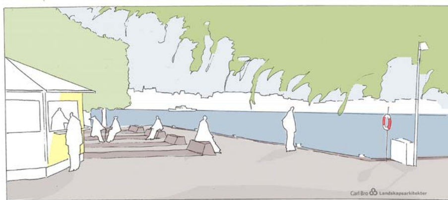
Figur Perspektiv från kajpromenaden respektive torgytan