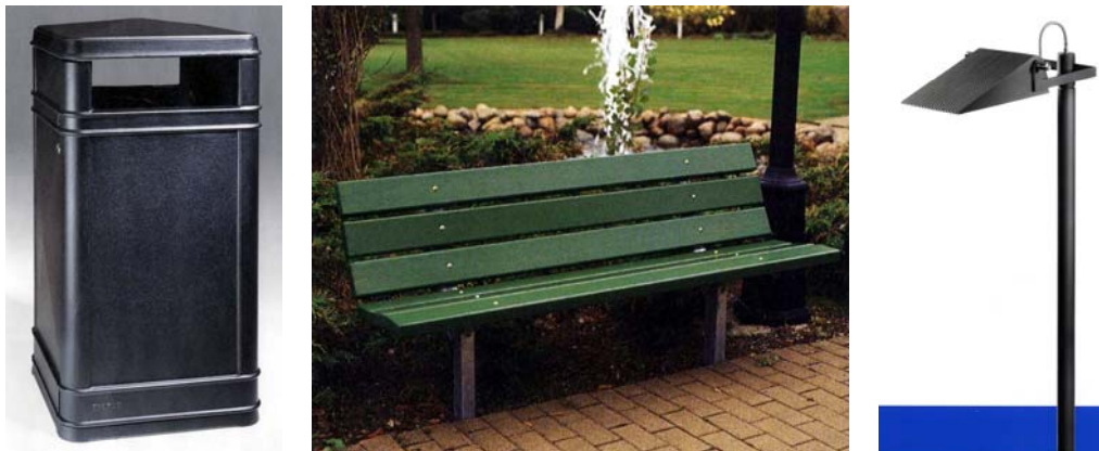
Figur Exempel på möbler; papperskorg Byarum, soffa Hags Djurgården och belysning Hess Novara.

Bänkar och papperskorgar byts ut och kompletteras. Nya vattenposter och elstolpar för båtarnas behov placeras i en möbleringszon längs med kajkanten. Den befintliga toaletten i trädraden mot Ragnar Östbergsplan byts ut mot en handikappanpassad toalett. I trädraden placeras även ett kombinerat sophus/elcentral. Byggnaden ersätter dagens elcentral samtidigt som båtarnas sopkärl utmed promenaden försvinner.