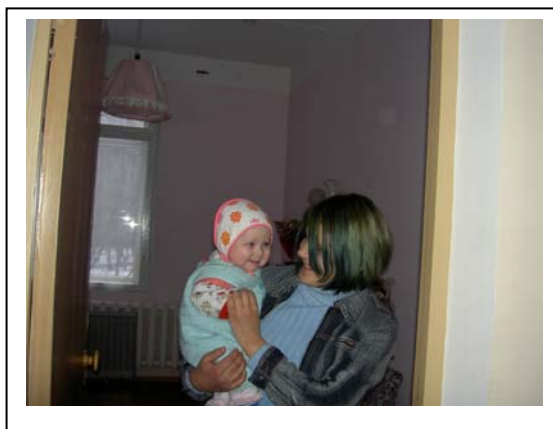
En ung mamma med sitt barn

Till hemmet remitteras de flickor som har upptäckt sin graviditet så sent att abort inte är möjlig. Ingen av flickorna har planerat sin graviditet och de flesta skulle ha gjort abort om man upptäckt sitt tillstånd tidigare. Man har därför dålig uppfattning om vad barn behöver och hur man ska ta hand om sig själv under graviditeten. Vistelsen på hemmet är en läroperiod för att öka förutsättningarna för de unga mammorna att klara att ta hand om sitt barn. Eftersom man själv vuxit upp på barnhem och vet vilket tufft liv det är vill man göra sitt yttersta för att undvika att ens barn hamnar i den situationen.