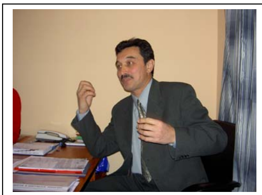
Biträdande chefen informerar om centrets förebyg- gande arbete

Centrum för tillsynslöshet och narkotikaberoende bland minderåriga i St. Petersburg är en ny verksamhet. De arbetar för att förebygga narkotika missbruk, hemlöshet och kriminalitet hos ungdomar. Verksamheten ska stödja och uppmuntra lokala initiativ i de 19 stadsdelarna i St. Petersburg. Verksamheten har 11 anställda socialpedagoger och socialarbetare.