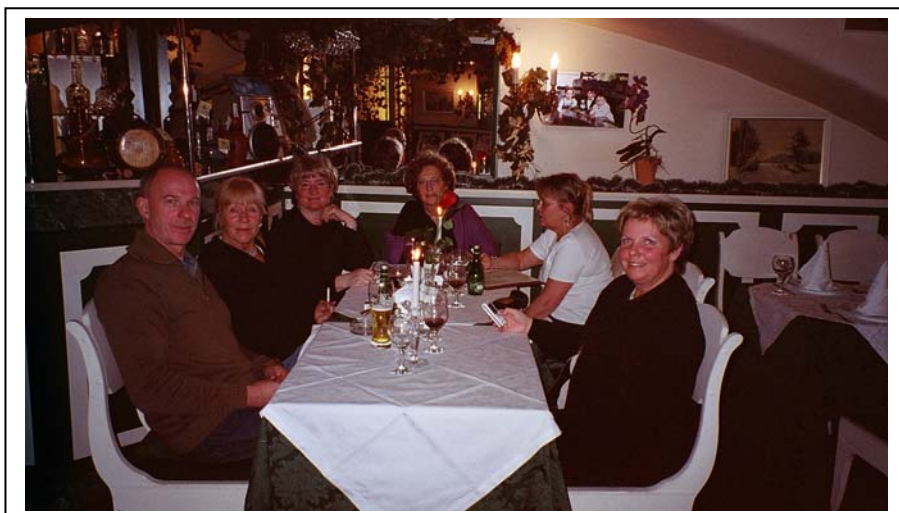
Middag på en trevlig georgisk restaurant

På det hela taget kändes många frågor igen från Stockholms verksamheter. Det var inte så stor skillnad på verksamhet, struktur och diskussioner. En avgörande skillnad var den materiella standarden och löneläget. Ledningen var ändå stolta över sin verksamhet, och de framhöll att standarden var god med ryska mått mätt, faktiskt bodde gästerna bättre än vad t.ex. många studenter gör.