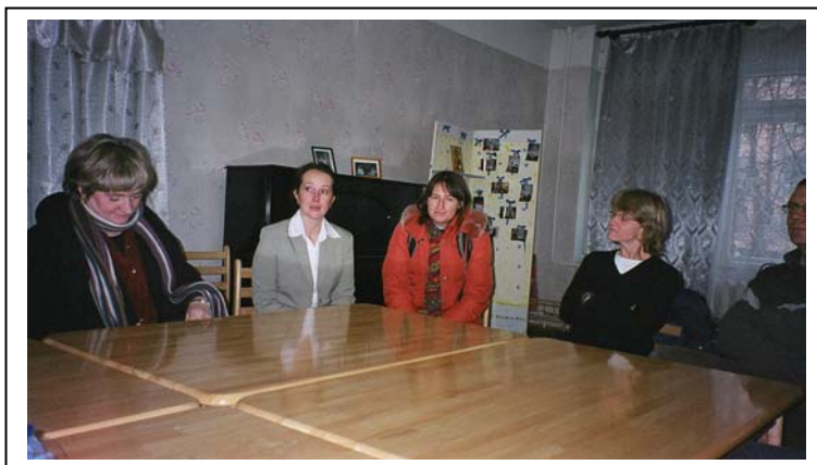
Föreståndaren informerar om verksamheterna på Kriscentret och Lilla mamman

Det som är positivt är att massmedia börjat uppmärksamma området våld mot kvinnor i nära relationer och man diskuterar nu frågan om man skulle kunna publicera verksamhetsberättelse och statistik från Kriscentrum i media.