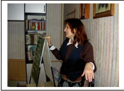
Barnen får skolundervisning på Vera