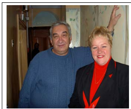
Föreståndare och personal tar emot oss på Vera

Vi tas emot av Veras föreståndare. "Vera", som på svenska betyder "Hopp" är ett av S:t Petersburgs av sju allmänna utredningshem/sociala rehabiliteringscentra för hemlösa och tillsynslösa barn. Därutöver finns sju liknande utredningshem som drivs privat. Centret startade 1997 och har 31 dygnetruntpatser för barn i svåra livssituationer.