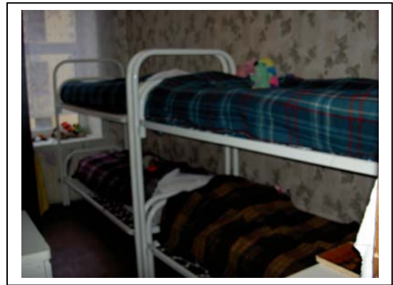
Ett av rummen

Vistelsetiden på Vera rör sig mellan två månader och tre år. Barnen indelas i syskongrupper som delar rum. De yngre barnen undervisas i Veras skola medan de äldre går på yrkesskolor ute i samhället. Ambitionen är att Vera ska ha en så hemlik miljö som möjligt och att varje barn ska få ett individuellt bemötande. ”Det är genom att se varje enskilt barn som man skapar förtroende”, ”att alltid visa sig beredd att hjälpa”. Barnen ska också se och uppmärksamma sig själva.