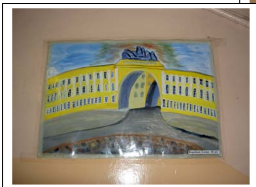
Några av barnens målningar

Efter att föreståndaren, med värme och engagemang, berättat om verksamheten får vi gå runt i lokalerna och titta in i en liten skolklass. Här är slitet och inredningen är ändamålsenlig men enkel. Väggarna pryds av bilder över S:t Petersburgs palats som barnen målat i samband med stadens 300-årsjubileum. Fantastiska, kraftfulla konstverk målade av små människor i en svår livssituation och med dessa på vår näthinna lämnar vi centret med en känsla av att här finns, trots allt, mycket Hopp- Vera.