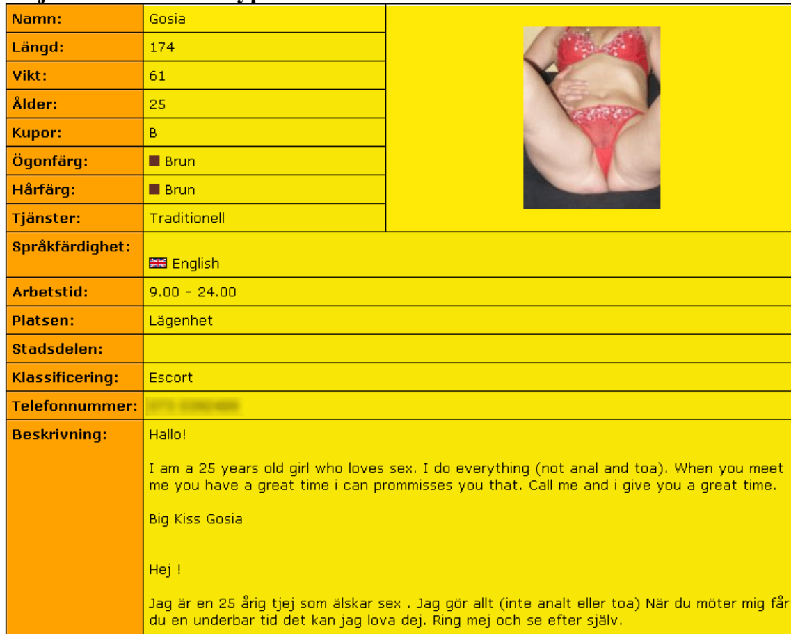
Bild 2. Exempel på hur en annons kan se ut. Texten beskriver kvinnans utseende, vilka tjänster som ges och inte ges, att det finns ett kondomkrav, priser och kontaktmöjlighet.

Skillnaden från annonstyp 2 är att informationen inte presenteras i ett forum utan som produkter i ett större sammanhang där alla prostituerade presenteras inom samma ramar med samma möjligheter. Produktifieringen är total, det skulle kunna handla om litteratur, kläder eller elektronik, istället är det prostituerade som erbjuder sig till försäljning.