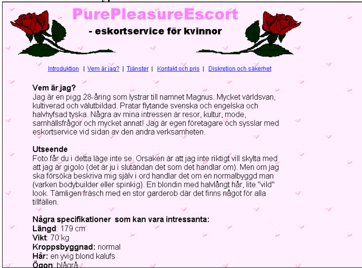
Bild 4. Exempel på hur en webbsida kan se ut. Just på denna sida är designen ljus och lätt – möjligtvis för att tilltala målgruppen.

Webbsidan innehåller flera sidor som ger bakgrundsinformation och annan information för att underlätta kontakt och köp. Här kan köparen navigera i gränssnittet och läsa mer vid intresse.