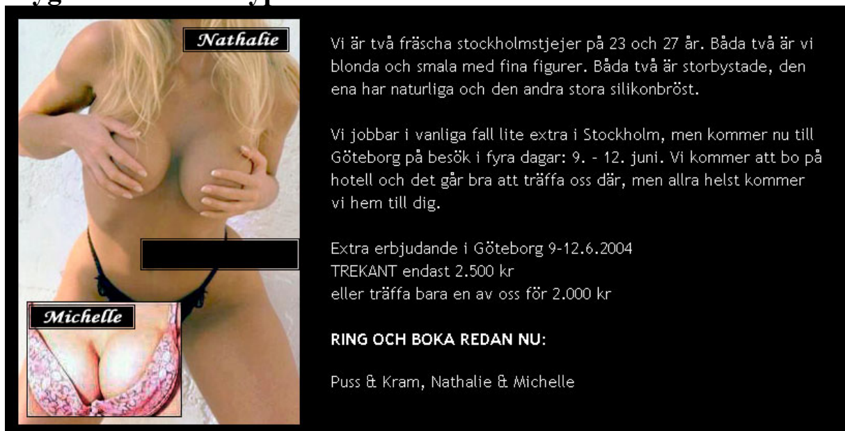
Bild 1. Exempel på en hur en annons kan se ut. Detta sätt att marknadsföra sig liknar ”flygbladsmetoden”.

Bilden eller flygbladet innehåller den information som sexsäljaren vill nå ut med och som sexköparen behöver för att ta ett köpbeslut. Flygbladet distribueras på olika sätt på nätet. Via e-post, på webbsidor, som bilagt dokument på forum och så vidare. Det framgår, vilket är vanligt, att sexsäljaren arbetar på flera orter.