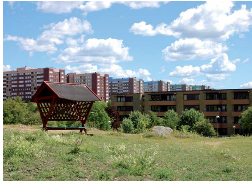
Blandad bebyggelse i Akalla

Sedan inriktningsbeslutet hösten 2007 har en rad aktiviteter kommit igång inom Järvalyftets ram. Vad som hittills saknats är en samlad bild av Järvalyftet, en konkretisering av målbilden. Vad kan på sikt bli resultatet av dessa aktiviteter? Detta dokument är bara ett första förslag, framtaget inom staden för att fungera som underlag och inspiration