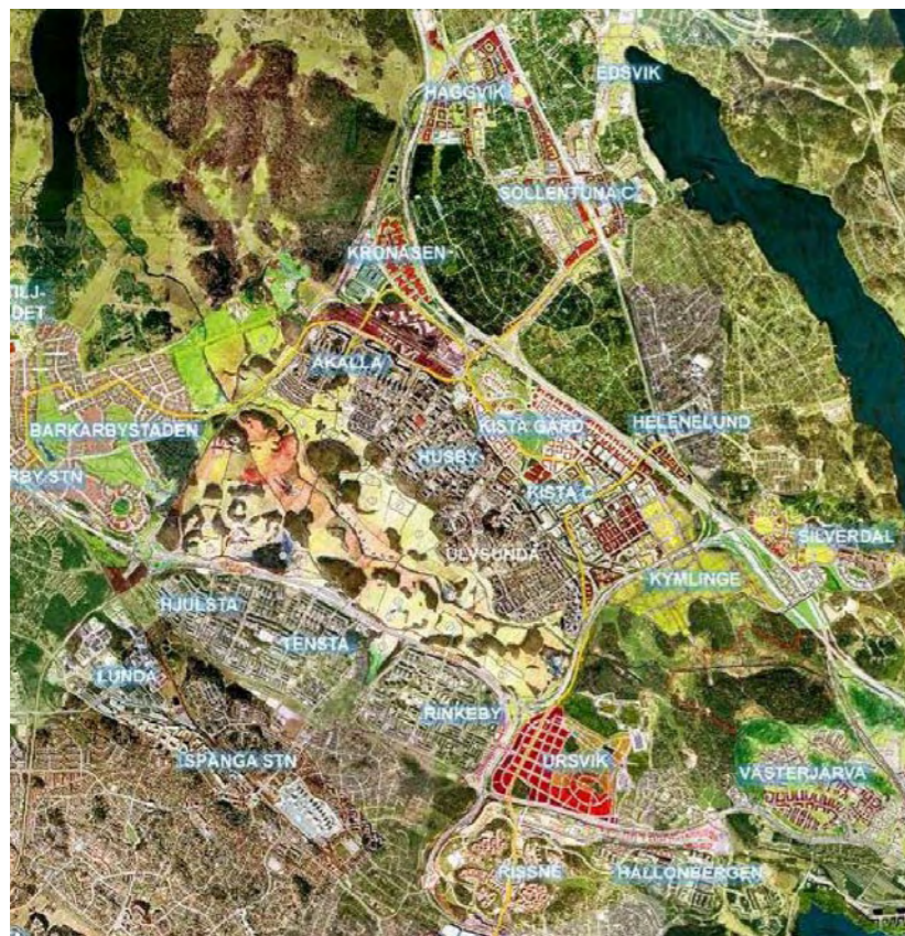
”Stadsdirektörskartan”, visar planering över kommungränserna

Summan blir större än de enskilda delarna, ett faktum som även är utgångspunkten för det samarbete över kommungränserna som växt sig allt starkare kring Järva under senare tid. Allt fler dokument tas idag fram, som visar Järva i ett större perspektiv, där all utveckling som pågår kring Järva i Stockholm, Solna, Sundbyberg, Sollentuna och Järfälla bildar en gemensam helhet.