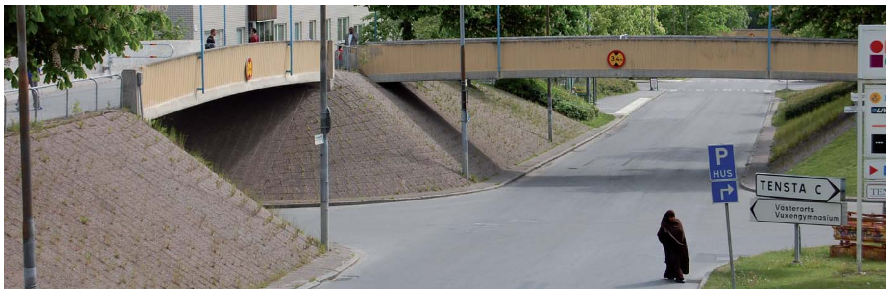
Trafikseparering i Tensta

Repliken ovan är en viktig utgångspunkt för trygghet i vardagen. Att möta folk man känner på vägen till skolan, jobbet, affären och tunnelbanan är ofta en grund för att känna trygghet och trivsel där man bor. I Järva, liksom i andra stadsdelar, är hemkänslan stark och att bibehålla och förstärka den är en viktig del i Järvalyftet. Att bygga stadsdelar med stark identitet är att bygga trygghet.