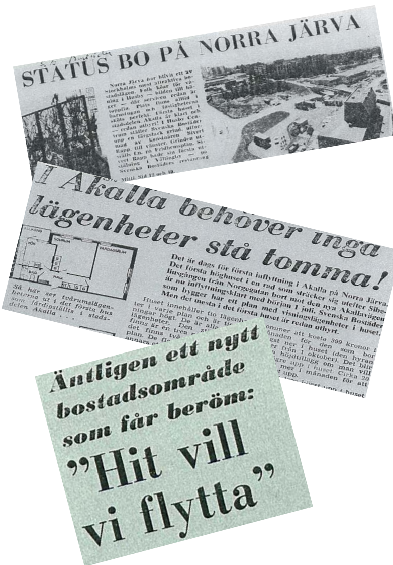
Tidningsutklipp från tiden när Järvastadsdelarna byggdes

Tillväxt är stadens naturliga tillstånd. Stockholm kan och vill växa och just nu befinner sig staden i en stark befolkningsmässig och ekonomisk expansion. Till år 2030 kan dagens invånarantal 795 000 växa till nära en miljon. Detta kommer att ställa stora krav på staden, i synnerhet som målet inte bara är en kvantitativ, utan även en kvalitativ utveckling. I stadens samlade Vision 2030 beskrivs en framtidsbild för ett Stockholm i världsklass. En stad som är mångsidig och upplevelserik, innovativ och växande, ett medborgarnas Stockholm.