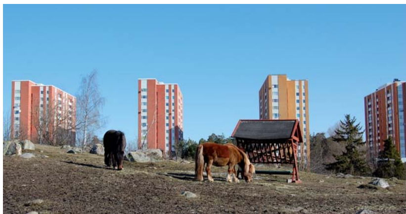
Akalla sett från Järva friområde

Egyptens pyramider var ett av antikens sju underverk, det enda som överlevt in i vår tid. Sämre förebilder kan man ha när man bygger nytt. Målet med Vision Järva 2030 måste vara att varje nytt tillägg tillför området kvaliteter – arkitektoniska såväl som innehållsmässiga. Citatet ovan från en Järvabo handlar om förslaget till ny bebyggelse ovanpå nya E18 vid Rinkeby och visar vilken betydelse ett enskilt projekt kan få för bilden av framtidens Järva, både bland boende och besökare.