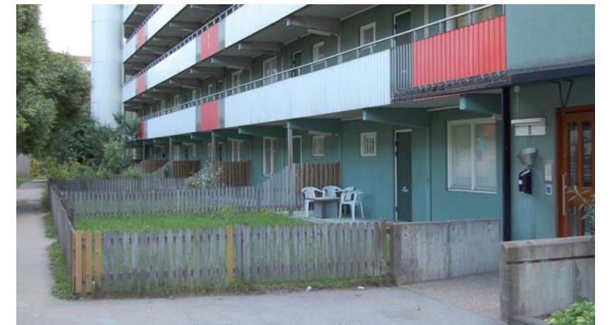
Entré i Husby

Att stärka hemkänslan är att stärka tryggheten. Det gör stadsdelarna attraktiva för dagens boende, men också för framtidens invånare. För den som funderar på att flytta till ett område är tryggheten en mycket viktig faktor.