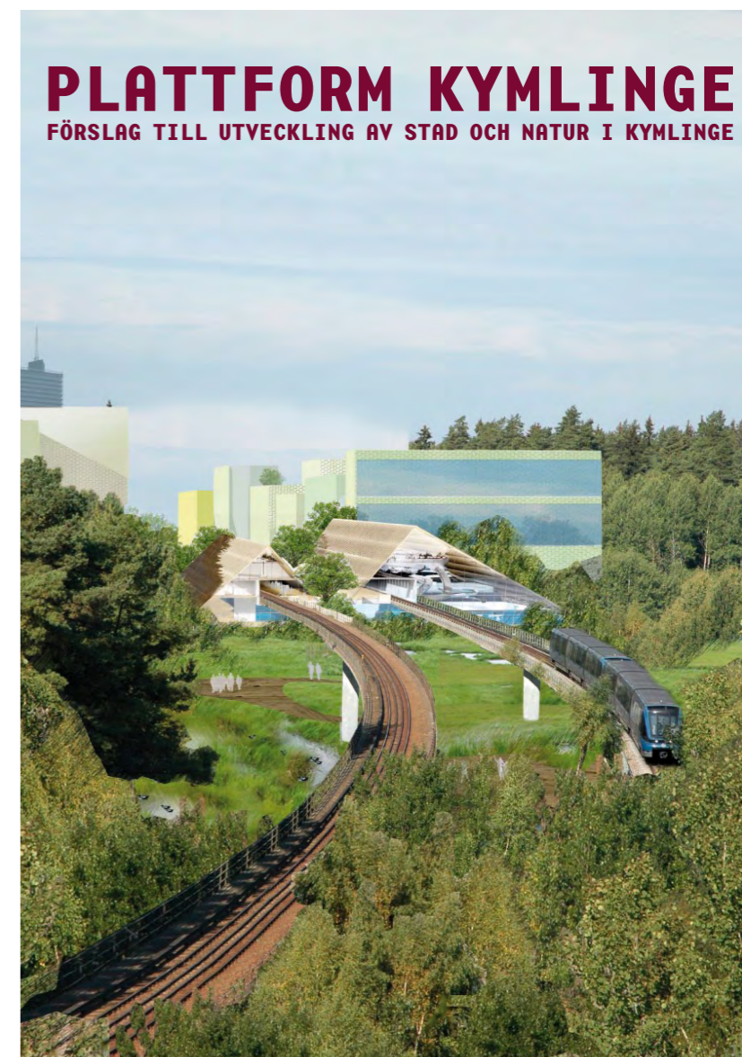
Exempel på närliggande stadsutvecklingsprojekt, Vasakronan

Visionen måste vara hållbar över tiden och därför är spelplanen öppen för att nya idéer kan tillkomma och andra kan utgå inom Järvalyftets olika områden. Men även om matchen – förslagen – böljar fram och tillbaka bör spelplanens hörnstolpar stå fast.