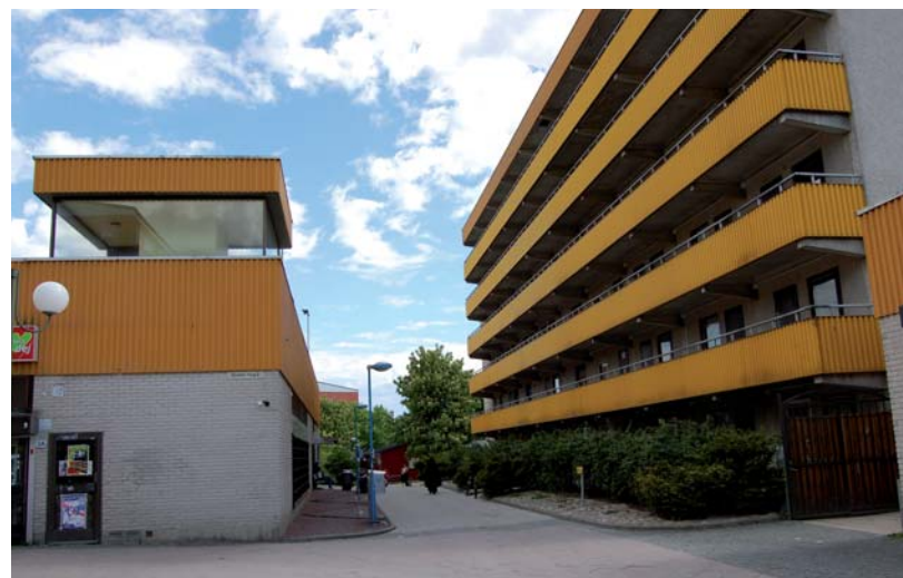
Loftgångshus i Hjulsta

Järvas arv från miljonprogrammet är en stark och tydlig struktur med för- och nackdelar. När området förnyas gäller det att förvalta och utveckla befintliga kvaliteter och samtidigt åtgärda dagens brister. En agenda för detta ur ett brett stadsbyggnadsperspektiv är en viktig del av denna vision. Längre fram beskrivs ett antal utvecklingsteman. För att låna devisen från Tensta Bo 06 handlar det om att arbeta med ”förortens utmaningar och miljonprogrammets möjligheter”.