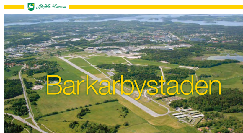
Exempel på fördjupad översiktsplan Barkarbystaden, Järfälla kommun

långt i planeringen av den nya Barkarbystaden, som på sikt kan rymma 5000 lägenheter. I Sollentuna tillkommer ett tusental lägenheter i och kring centrum när detta förnyas och i Silverdal pågår redan utbyggnaden av en ny trädgårdsstad.