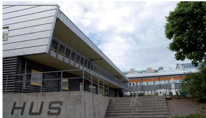
Ungdomens hus, Rinkeby

Här ska bjudas en god inre och yttre miljö, hjälp med läxläsning och en meningsfull fritid. En särskild utmaning ligger i att stödja flickors integration, där skolan ofta utgör enda länken ut i det svenska samhället. Här finns stora möjligheter till ökat samarbete med ideella organisationer och näringsliv. Ett exempel är Idrottslyftet, som syftar till ökad idrottsaktivitet bland ungdomar kring Järva i allmänhet och bland tjejer i synnerhet. Hundratals ungdomar har redan nåtts med olika aktiviteter.