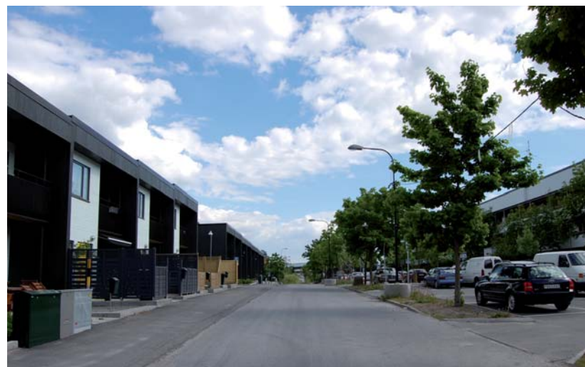
Nya radhus i Hjulsta