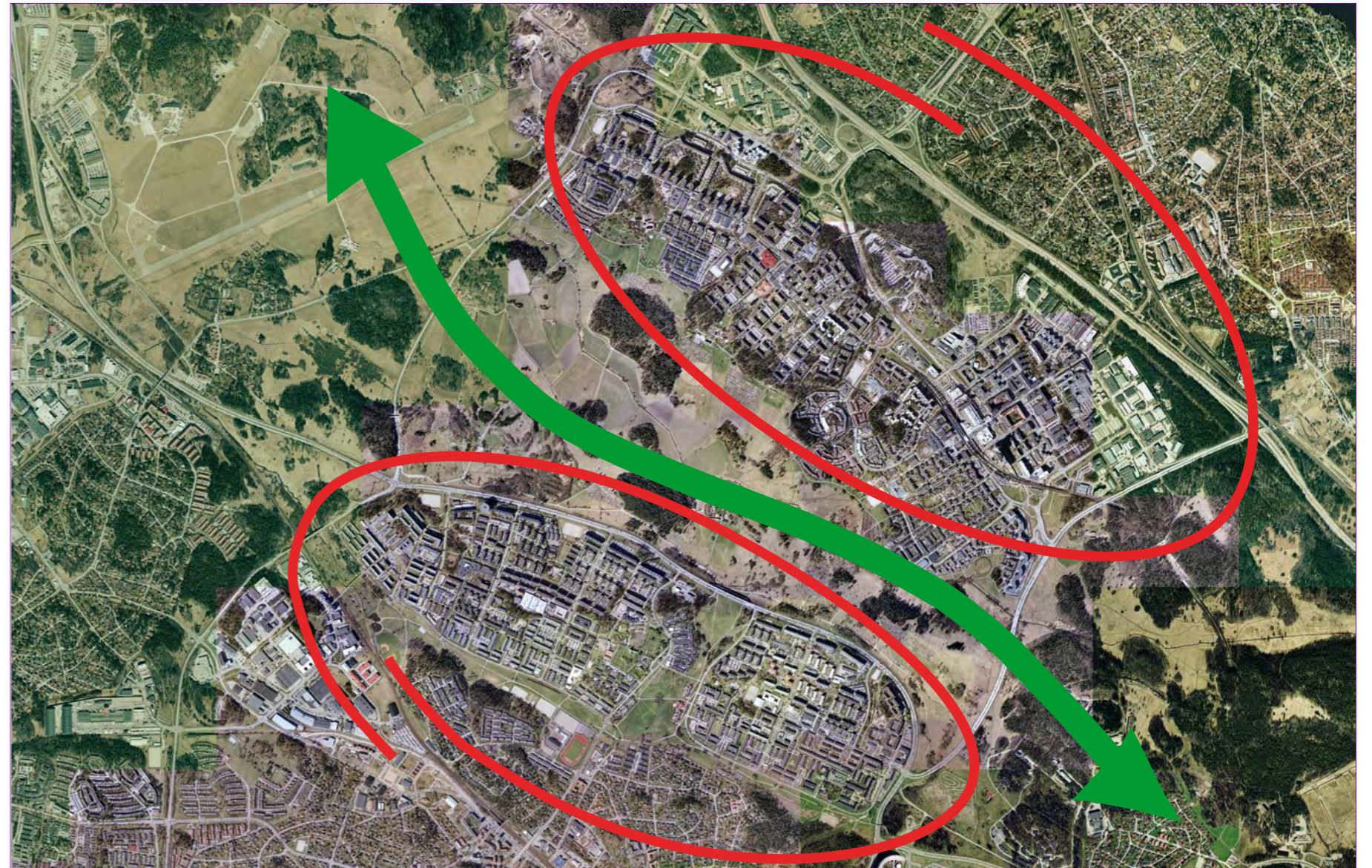
Tre delar; Norra Järva, Södra Järva och Järva friområde