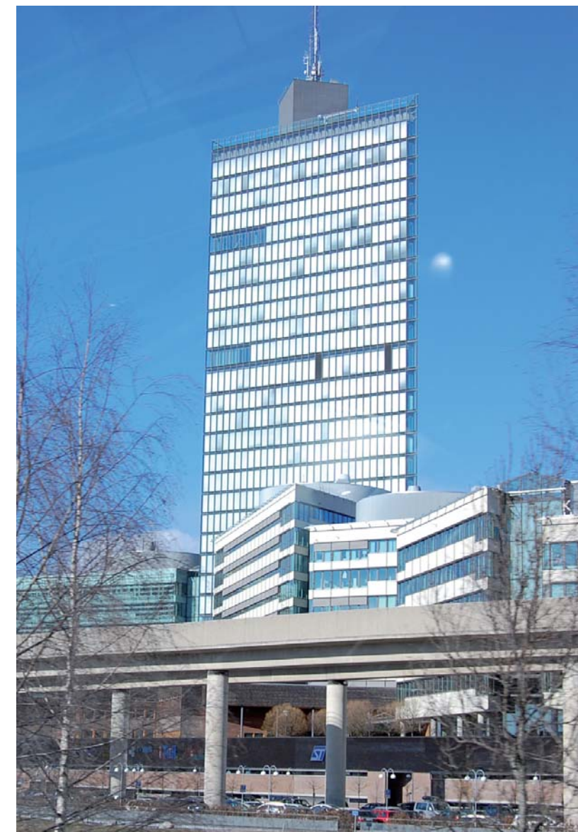
Kista Science Tower

Det handlar om att möjliggöra för människor som ofta gått lång tid utan jobb att komma tillbaka, människor som ofta saknar erfarenhet av svensk arbetsmarknad och där utbildning och språkkunskaper kanske brister. Kan denna klyfta överbryggas är vinsterna stora – både för den enskilde och för samhället.