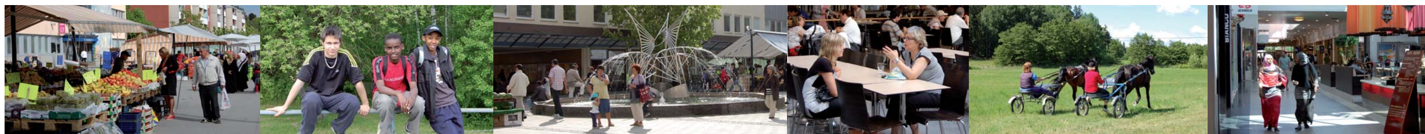
Järvastadsdelarna av idag

Vision Järva 2030 har utarbetats av en projektgrupp under ordförandeskap av: