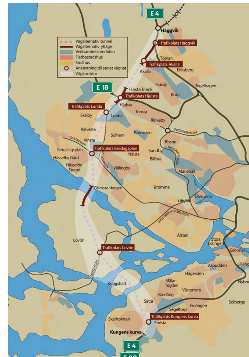
Förbifart Stockholm, illustrationsplan, Vägverket

Till innovationsrikedom och växtkraft bidrar naturligtvis Kistas världsledande IT-företag, men också den stora småföretagarpotentialen inom framför allt tjänstesektorn.