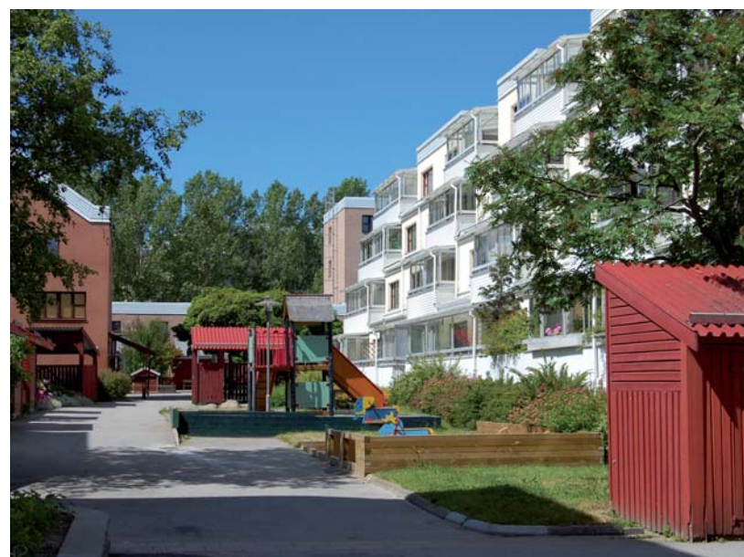
Gårdsmiljö i Kista

I t ex Husby och Rinkeby har kommunal hyresrätt från första början varit en helt dominerande upplåtelseform. Även här måste det till en ökad variation. Dels genom att vid nybyggnation sträva efter fler bostads- och äganderätter, men även genom att möjliggöra omvandling till bostadsrätt, där hyresgäster så önskar. Att öka antalet aktörer på Järvas hyresmarknad som nu sker är också en viktig väg mot ökad variation. Mångfald berikar även i detta avseende.