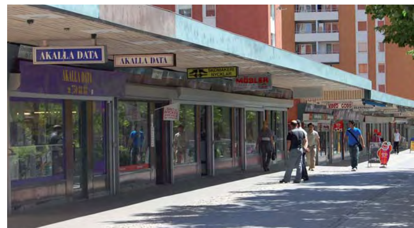
Småföretagare i Akalla

Inget land kan leva enbart på högteknologi. Annat måste till, inte minst inom servicenärigen. Här finns stor potential inom vitt skilda områden. Vi vet alla hur svensk matkultur breddats och berikats under de senaste decennierna genom impulser från utländska kök. Varför syns inte mer av det i Järvastadsdelarna i ett rikare restaurangutbud, i nya saluhallar, i en kvalificerad livsmedelsutbildning?