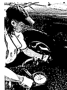
Öka trycket med tio procent, så blir färden både säkrare och renare.