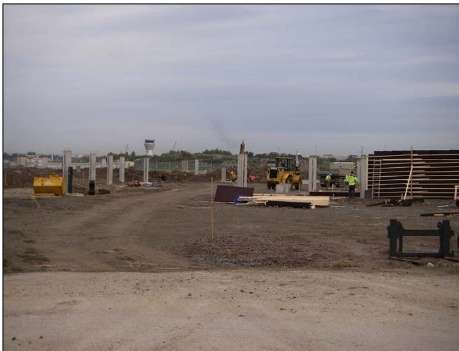
ÅVC Bromma 061010

ÅVC Bromma, Luftfartsverkets område, Kvarnbacksvägen Bromma Publikt namn för anläggningen blir ÅVC Bromma, ersätter tidigare arbetsnamn Linta. Miljötillstånd från länsstyrelsen har erhållits. Markavtal har tecknats med luftfartsverket och entreprenadavtal med NCC i enlighet med nämndbeslut 060621. Uppförandet påbörjades v32 och fortskrider i enlighet med tidsplan. Dåligt skick på befintlig tillfartsväg medför större åtgärder än förväntat. Breddning av tillfartsväg och övriga åtgärder utanför själva ÅVC området bör dock kunna avslutas under året. Enligt tidsplanen skall bygget slutföras till 31/6 2007. Driftstart planeras till 1/8 2007. Upphandling av driftentreprenör och utrustning kommer att ske under vintern. Upphandling av miljöstation till anläggningen pågår.