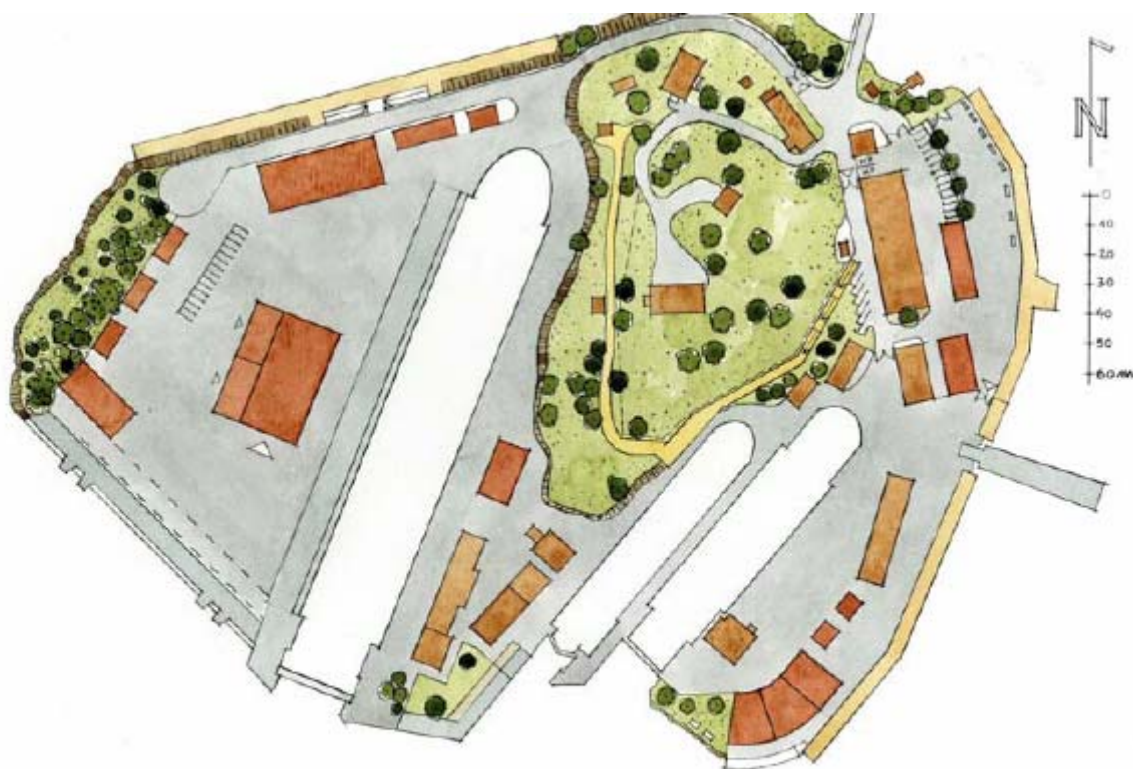
Illustrationsplan alternativ 1

Det övre planet nås från en punkt vid lusthuset på det centrala höjdpunktiet på Beckholmen. Utsikten över verksamheterna och över Stockholm från den förhöjda gångvägen kan bli en ny spännande attraktion på Djurgården.