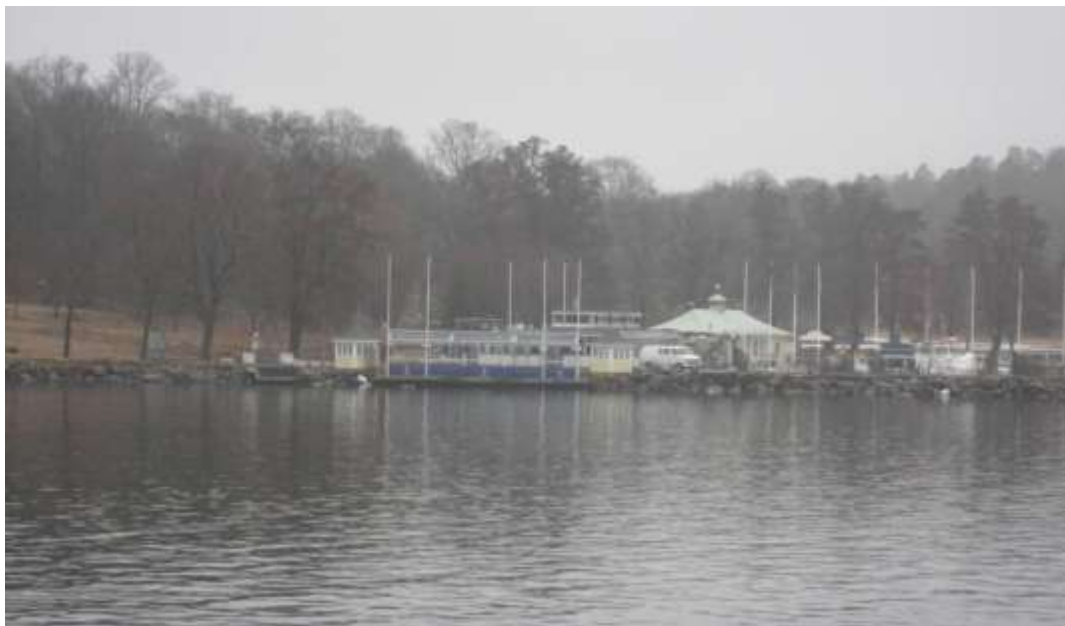
Den befintliga restaurangbyggnaden sedd från vattnet.

Nya regler för strandskydd trädde i kraft den 1 juli 2009. Kommunen får i en detaljplan bestämma att skyddet upphävs, om det finns särskilda skäl för detta. I det här planförslaget finns en bestämmelse som anger att strandskyddet upphävs inom kvartersmark, samt inom de vattenområden där bryggor får uppföras. Huvudskälet anges att mark- och vattenområdena används redan idag till den verksamhet som planen föreslår.