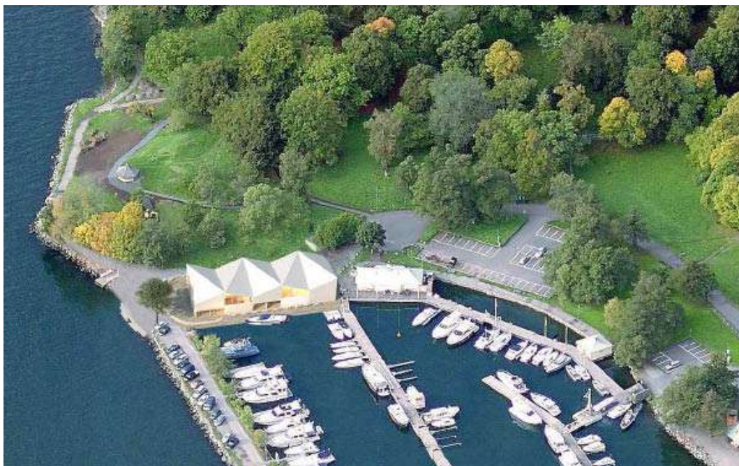
Den föreslagna restaurangen har en helt annan skala än marinans klubbhus i bildens mitt.