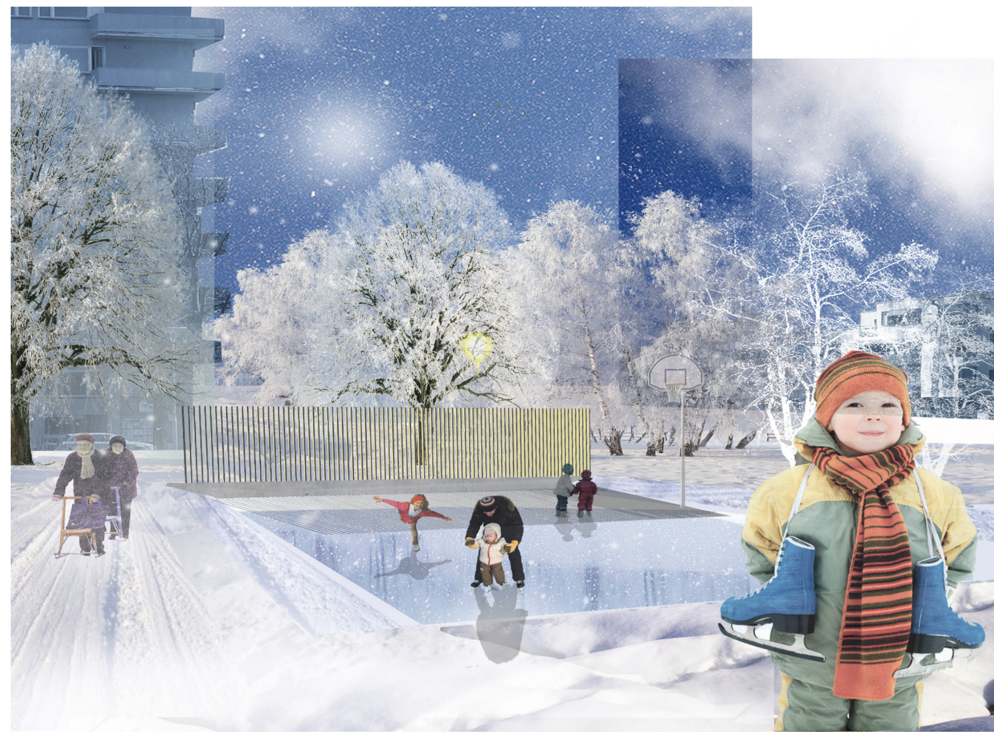
Bollplanen spolas till skridskobana på vintern