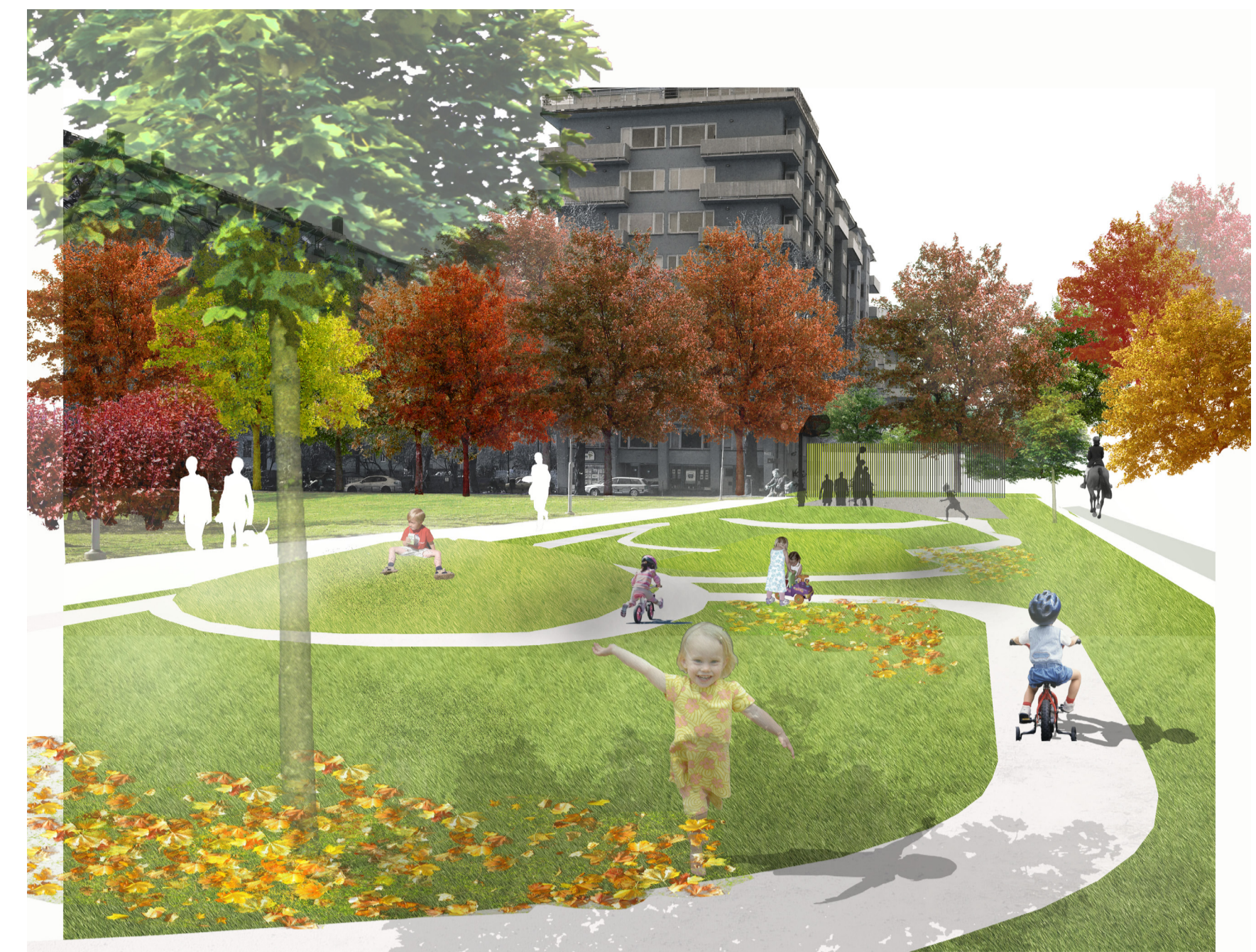
Asfalten rivs, ytan blir grön och kuperad med en cykelslinga för barnen.