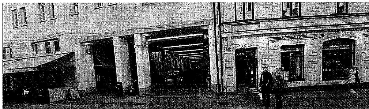
"Klarapassagen", Korgmakargränd idag

Från Klarapassagen vandrar besökaren fritt mellan kvarteren via de portar som idag hålls låsta. Genom att öppna de bakomliggande gårdarna och förbinda dem med omkringliggande