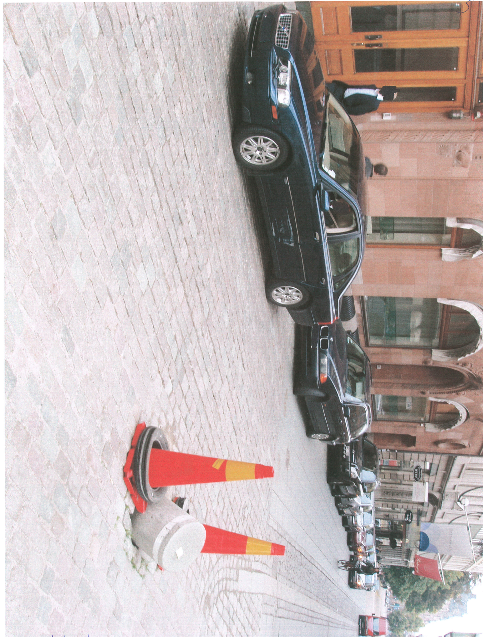
Blasieholmstorg 2005-10-14 Påkörd stenpollare och bil med intruckta dörrar