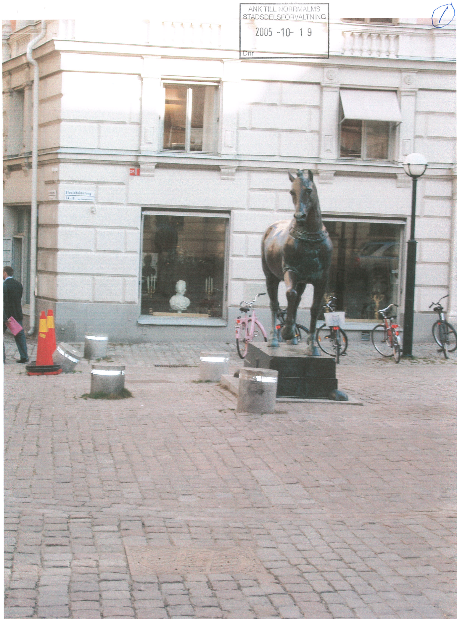
Blasieholmstorg 20051014 OBS! Alla stonpollarna är påkörda och sargade Den sneda pollaren är oreparerad sedan en månad tillbaka