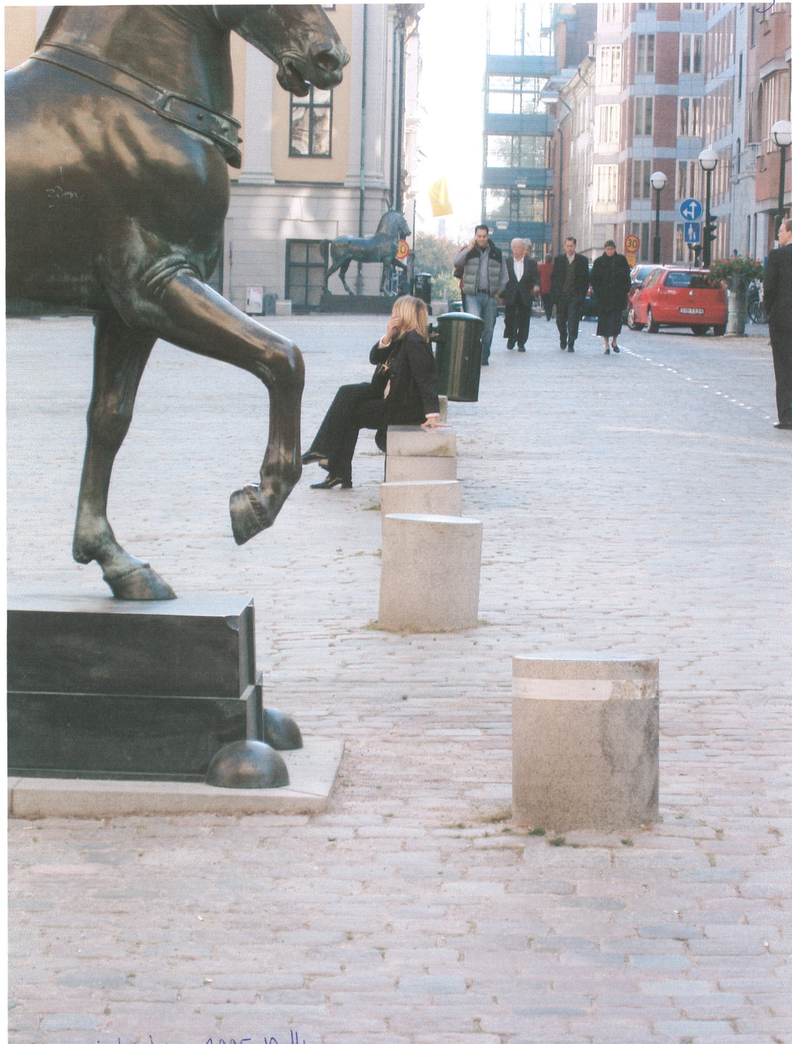
Blasieholmsborg 2005-10-14 Nästan alla stenpollare är påkörda och lutar åt olika håll.