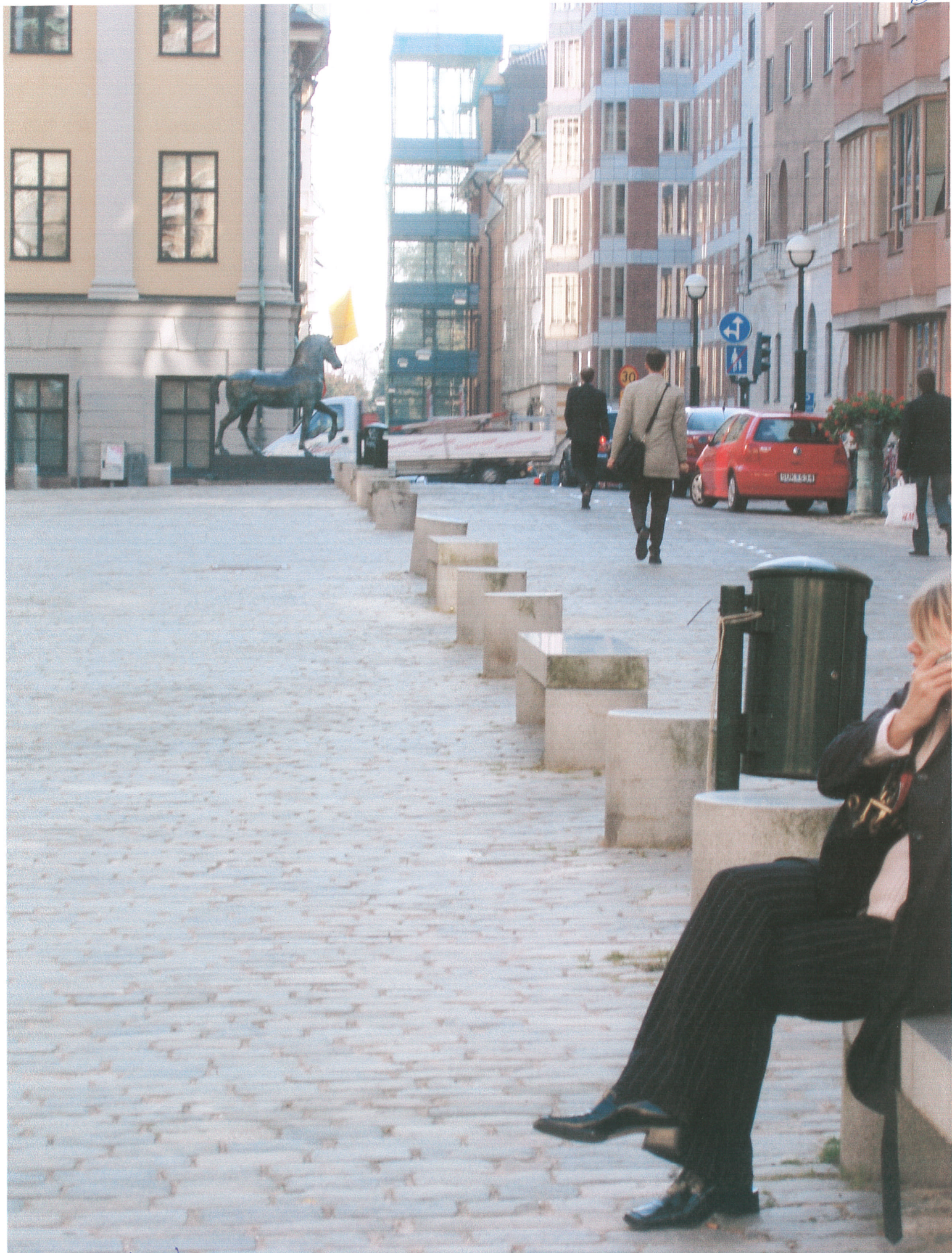
Blasieholmstorget 2005-10-14 De flesta stensömlarna är påkörda och lutar åt olika håll