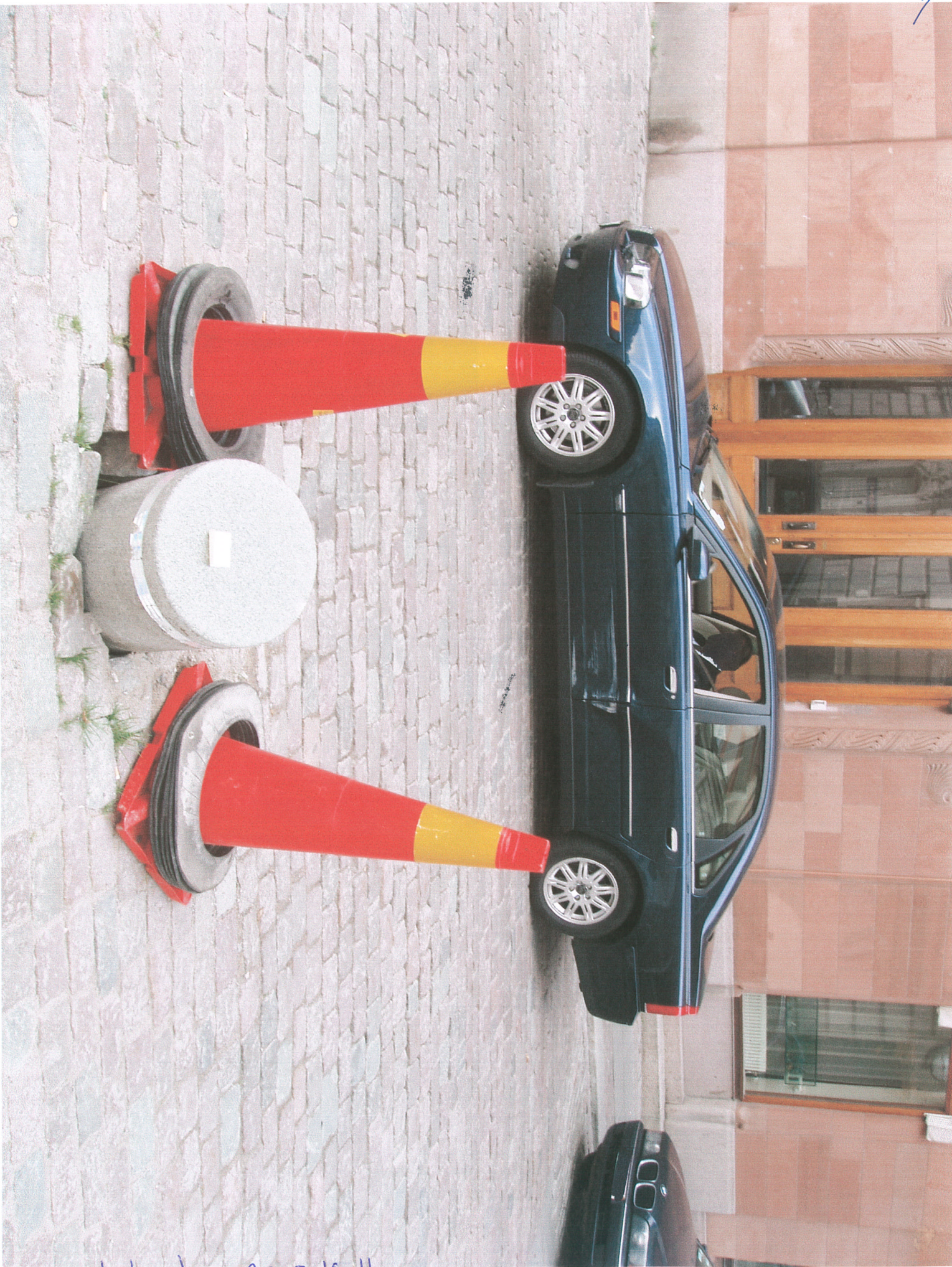
Blasvekolmstorg 2005-10-14 Påkörd stenpollare och bil med intryckta dörrar.