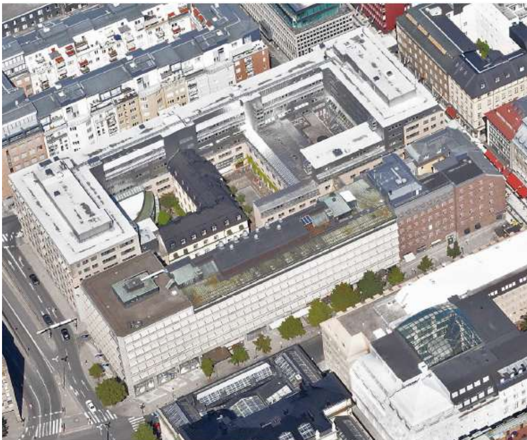
Snebild från söder

Genom föreslagen påbyggnad kan regeringskansliets kontorsverksamhet effektiviseras, vilket kommer att frigöra ytor i bottenvåningar för handel och service för en mer levande gatumiljö. Troligen kommer även ett eller flera kvarter att kunna frigöras för andra ändamål, vilket medför att Klara kan kompletteras med bostäder och kanske hotell eller andra publika verksamheter.