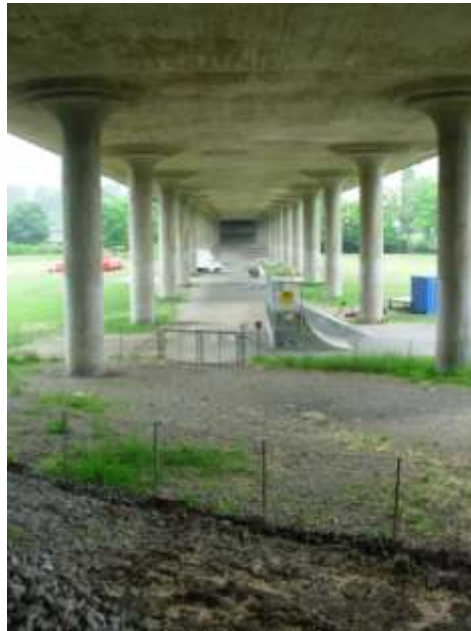
Plats för skatepark i Rålambshov under Lilla Västerbron

Som ett resultat av kartläggningen och arbetsgruppens möten ingår nu en skatepark belägen under Lilla Västerbron i programmet för upprustning av Rålambshovsparken. Under den andra hälften av bron – eller i anslutning till denna - kommer det att finnas ytor för annan spontanidrott som streetbasket, löparbanor, beachvolley och längdhopp. Inriktningen för denna del av parken är således spontanidrott, där olika former av skating är en snabbt växande sport.