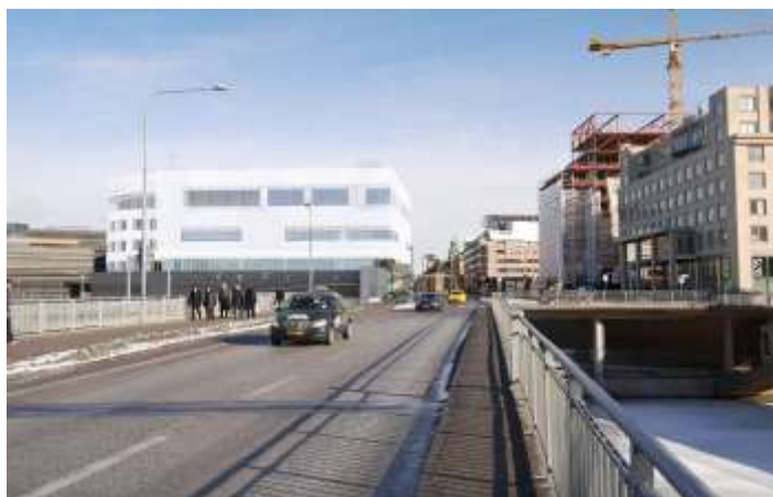
Perspektiv som illustrerar byggnaden i stadsbilden

Byggnaden utformas så att den passar väl in i stadsbilden samt binder ihop City med Kungsholmen. Funktioner, fasader och eventuell växtlighet ska ges en medveten bearbetning. Sammantaget ska fastigheten få en god arkitektonisk utformning som bidrar till att skapa ett mervärde i stadsbilden och gaturummet.