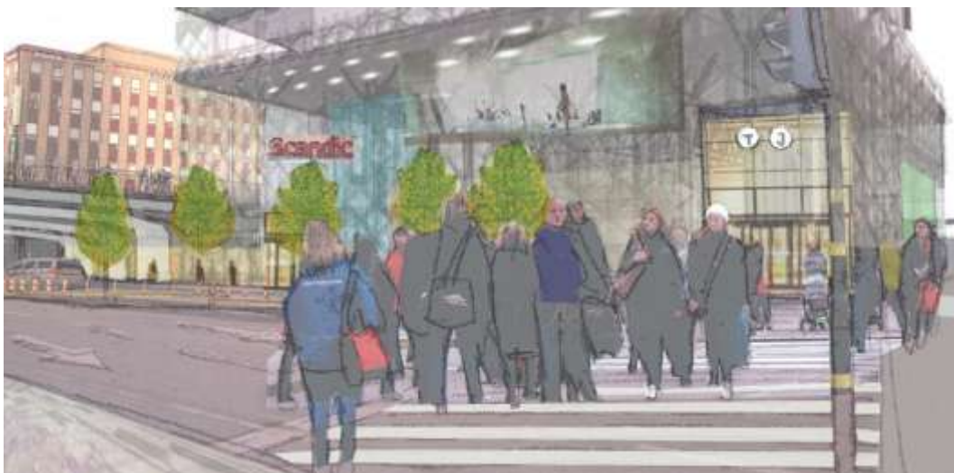
Stations- och hotellentréer mot Vasagatan. Offentliga rörelsestråk förbinder Vasagatan med Klarabergsgatan

Stationen omfattar de fyra nedre våningarna i hotellbyggnaden med entréer mot såväl Vasagatan som Klarabergsgatan. Den lägre byggnadsdelen mot Vasagatan ska ge plats till rulltrappor och ljusinsläpp till stationen.