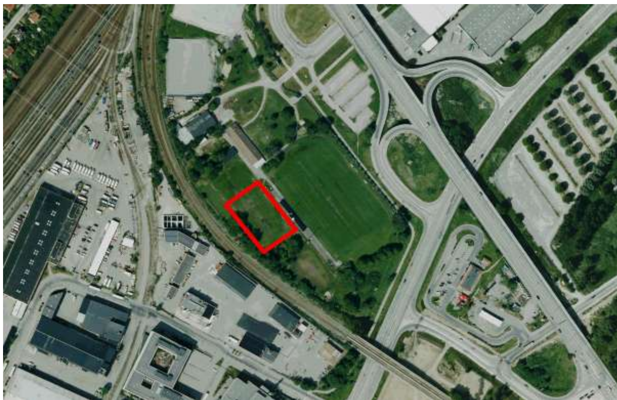
Bilden visar det föreslagna läget för bollplanen, röd inramning, längs med järnvägsspåret.

Älvsjö idrottsplats är belägen väster om Älvsjö trafikplats i stadsdelen Älvsjö. Idrottsplatsen består av en fullstor naturgräsplan (spelyta 105 x 65 meter), en 11-mannagrusfotbollsplan, en 7-manna grusfotbollsplan, två naturgräsytor, uppställningsyta och parkeringsytor. Vidare finns en omklädningsbyggnad med servering och personalutrymmen samt en förråds- och servicebyggnad.