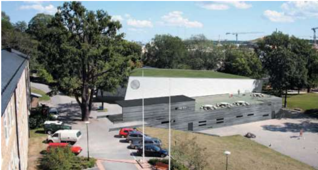
Förslag till utformning av Skanstullshallen mot skolgården.