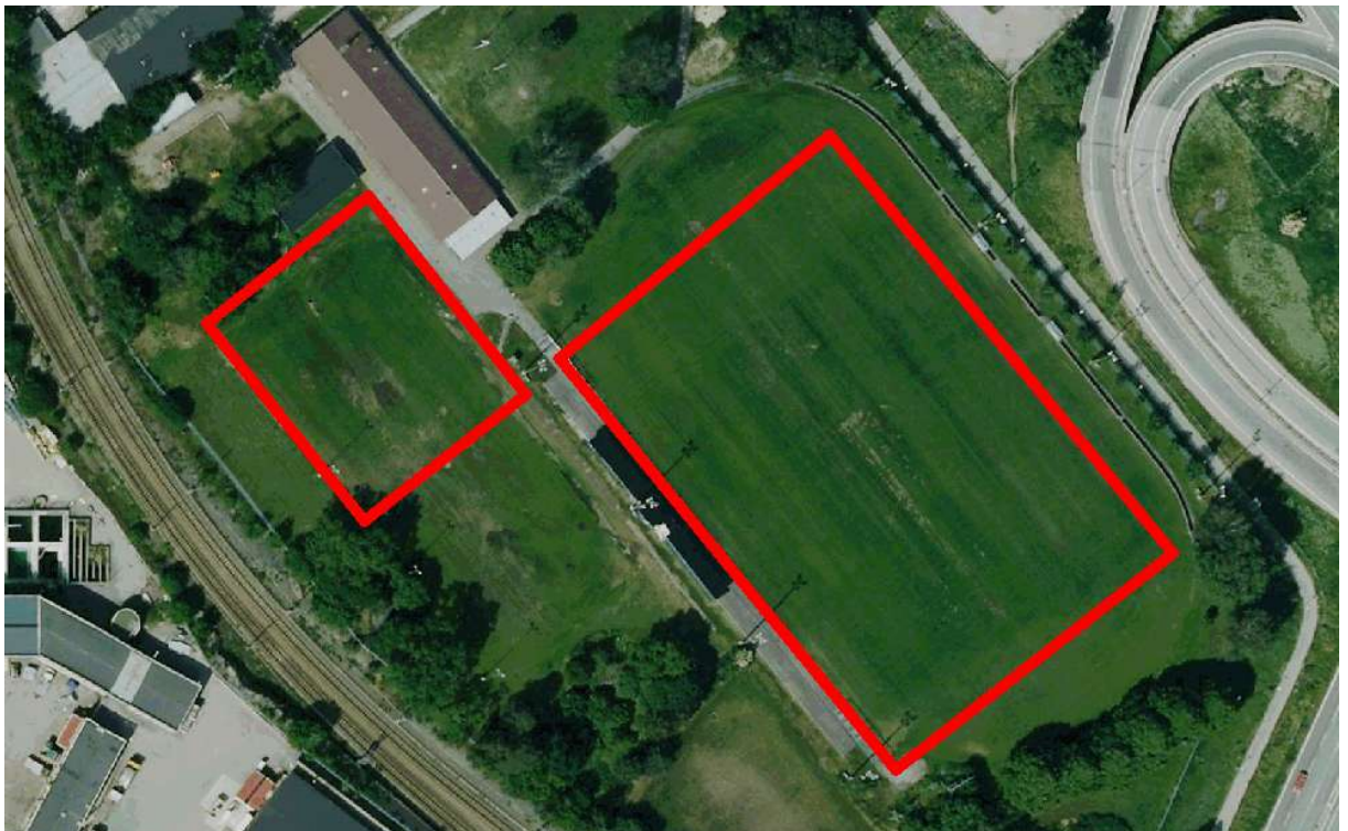
Bilden visar de föreslagna lägena för en 11-manna- och en 7-manna konstgräsplan.

Älvsjö idrottsplats är belägen väster om Älvsjö trafikplats i närheten av stockholmsmässan i stadsdelen Älvsjö. Idrottsplatsen består av en fullstor naturgräsplan (spelyta 105 x 65 meter), en 11-manna grusfotbollsplan, en 7-manna grusfotbollsplan, två naturgräsytor varav den ena ytan f.n. iordningställs med konstgräsplan, uppställningsyta och parkeringsytor. Vidare finns en omklädningsbyggnad med servering och personalutrymmen samt en förråds- och servicebyggnad.