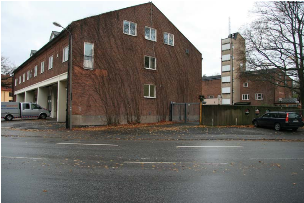
Bilden visar brandstationen i Midsommarkransen med gymnastiklokalen i bakgrunden.