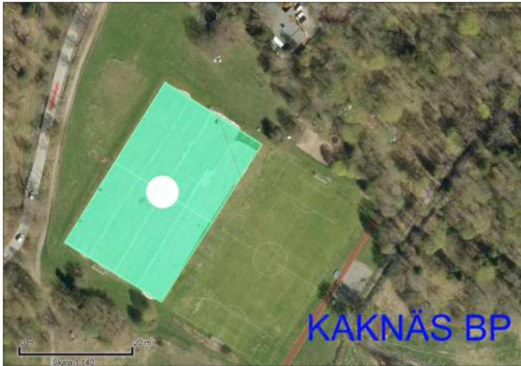
Bilden visar Kaknäs BP med konstgräs fotbollsplan.