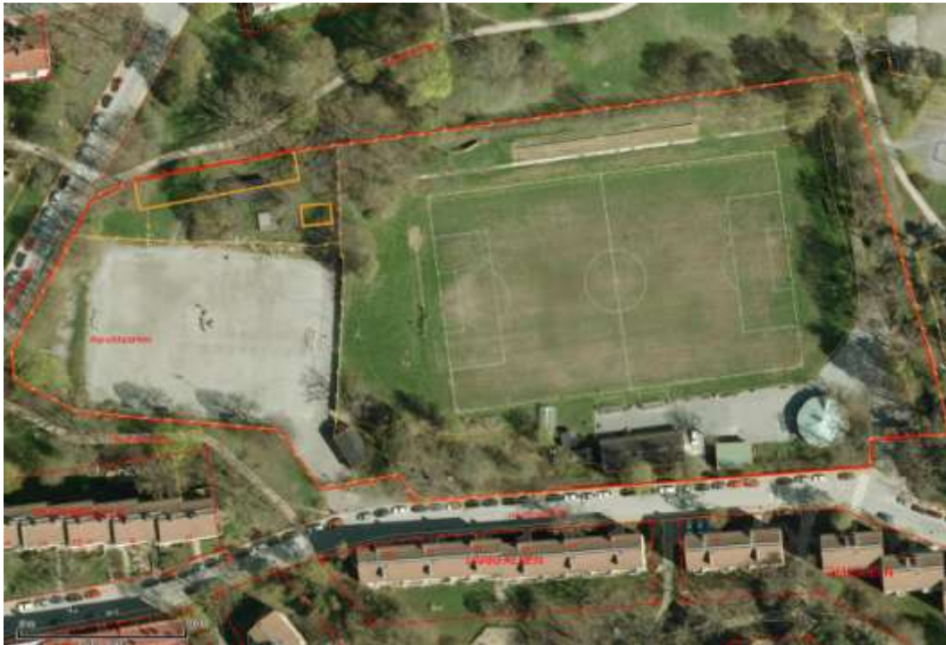
Bilden visar Aspuddens IP, röd inramning.

Aspuddens idrottsplats är belägen längs med Hövdingagatan, strax söder om Aspuddens skola i stadsdelen Aspudden. Idrottsplatsen består av en 11-manna naturgräsplan, en 7-manna grusfotbollsplan, skolfriidrottsytor, personal-, omklädnings- och servicebyggnader. Vidare finns en klubbhusbyggnad för IFK Aspudden–IK Tellus samt en paviljongförskola.