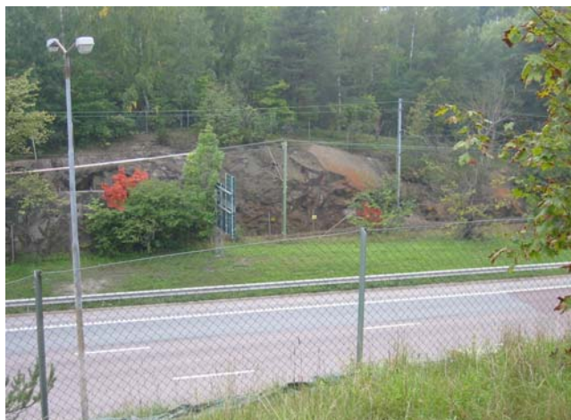
Roslagsvägen utgör en kraftig barriär.