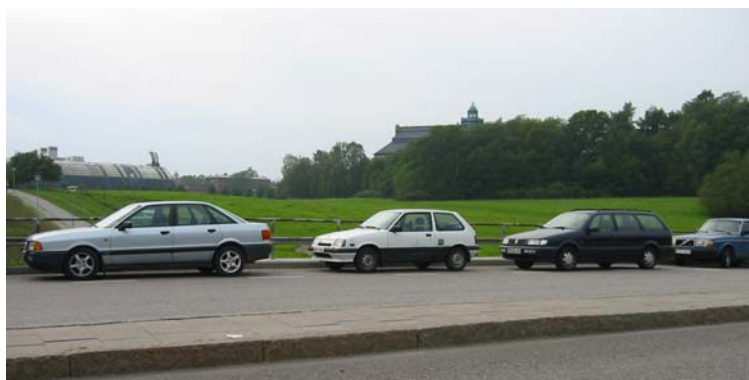
Infartsparkering på Bergiusvägen.

Enligt fördjupningsförslagets vägledning ska verksamheter som är särskilt trafikalkalstrande undvikas i de delar som definieras som natur- och parklandskap. Det är enligt förvaltningen av stor vikt att trafikfrågor kan lösas på ett miljömässigt och ur parkens synpunkt, godtagbart sätt. Utbyggnaden av stadsutvecklingsområdena Hjorthagen-Värtan-Frihamnen är trafikalkalstrande och utbyggnaden av Norra Länken löser inte trafikproblemen fullt ut. Kollektivtrafikförsörjningen av områdena är inte löst. Trafiken påverkar Nationalstadsparkens värden i mycket hög grad. En samlad trafikplan vore enligt förvaltningen värdefullt för området där kollektivtrafiken utvecklas, vattenvägarna utnyttjas bättre, cykelplaner läggs in och nya parkeringslösningar planeras för bil och cykel. Det kan finnas behov av beredskap för fler eller större besöksparkeringar då besöksstrycket ökar. I vissa delar utnyttjas marken idag som infartsparkering. Det kan ifrågasättas om det är vad marken ska användas till? På t ex Bergiusvägen infartsparkerar bilar på båda sidor om vägen.