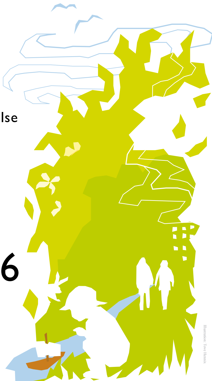
Illustration: Tove Hemrix