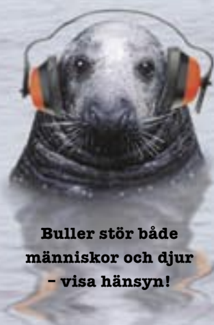
Buller stör både människor och djur – visa hänsyn!

FÖRRETTEN – visste du att det finns en lag, Sjölagen , som förbjuder att man i onödan stör sin omgivning genom att man t.ex. kör för fort och för nära andra? Upplever du hänsynslösa okynneskörare – kontakta sjöpolisen eller kustbevakningen för att göra anmälan!