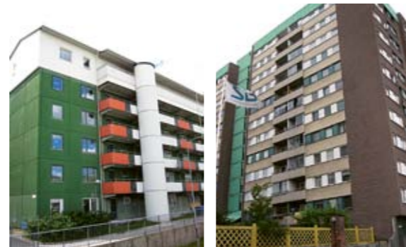
Lamellhus i Rinkeby, loftgångshus i Husby och skivhus i Akalla.