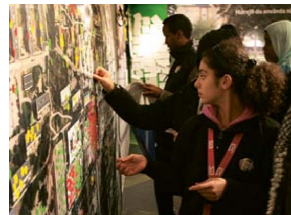
Järvadialogen i Akalla, Husby, Rinkeby och Tensta har totalt haft drygt 15 000 besökare.

Enbart satsningar på tekniska lösningar för att underlätta en hållbar livsstil räcker inte. En viktig del i projektet är en omfattande satsning på information till och dialog med de boende. Genom Järvadialogen får de boende möjlighet att lämna synpunkter och delta i beslut om renoveringen.