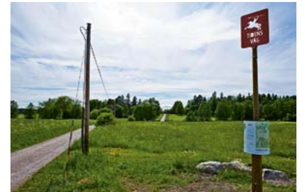
Tidens väg är en kulturhistorisk vandring på Järvafältet.

Bovärddar, miljövärdar, och miljöambassadörer i de sex renoverade husen utbildas för att sprida kunskap om en hållbar livsstil. Till de boende ges information om hur de kan spara energi, hur källsortering fungerar och var de ska göra av sitt farliga avfall. Alla lärare i skolor i Järvaområdet erbjuds miljöutbildningar. Även föreningar erbjuds utbildning i miljö- och klimatfrågor.