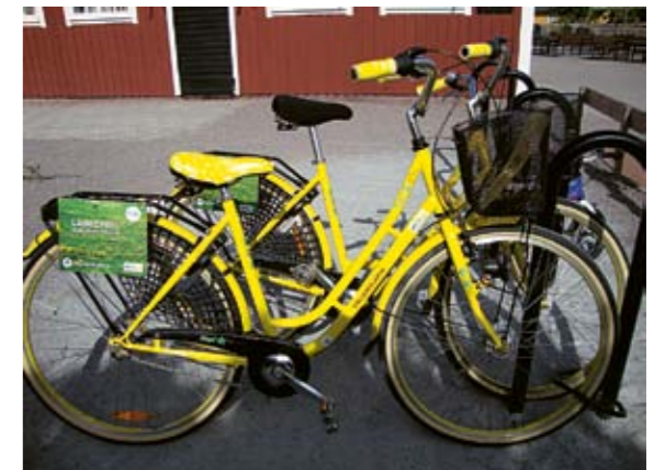
Låncyklar i Akalla by.

Kungliga Tekniska Högskolan följer projektet genom hela projektperioden för att utvärdera det både tekniskt och beteendevetenskapligt. En handbok som visar resultatet av de olika byggmetoderna och hur arbetet i de olika delarna av projektet har fungerat ska hjälpa andra att använda sig av resultaten.