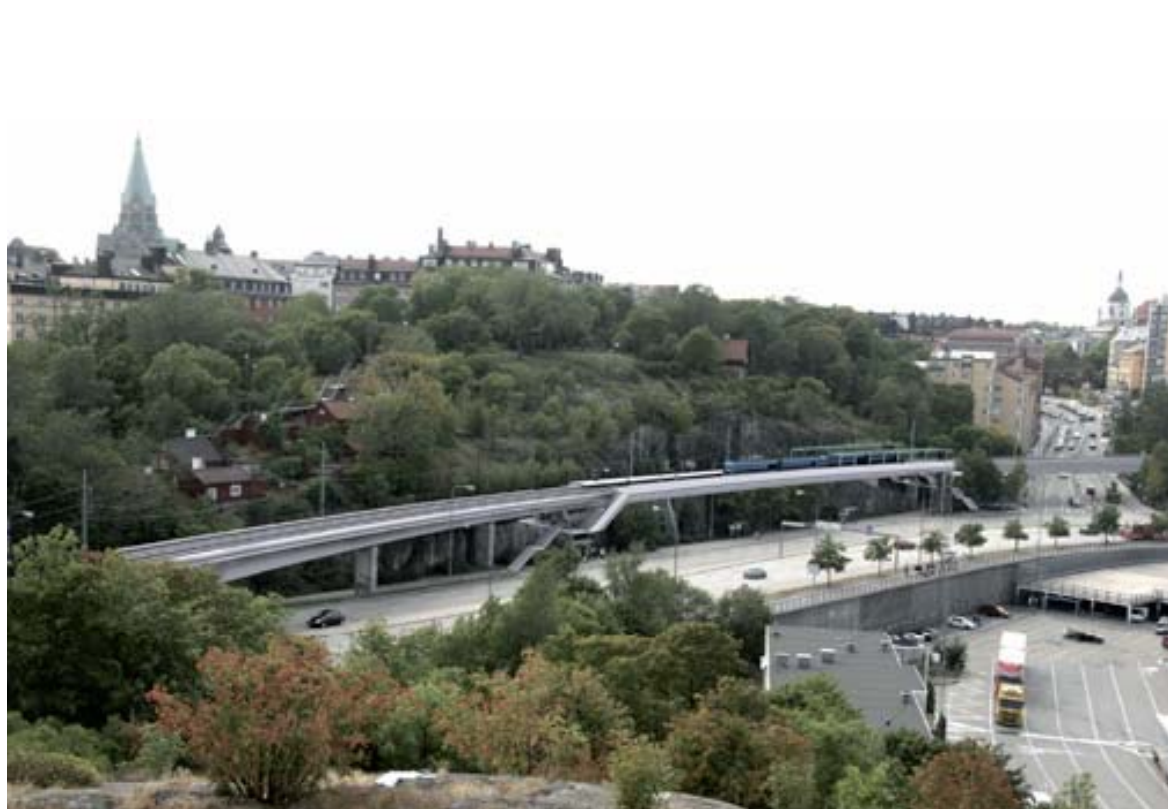
Illustration av stationen vid Åsöberget