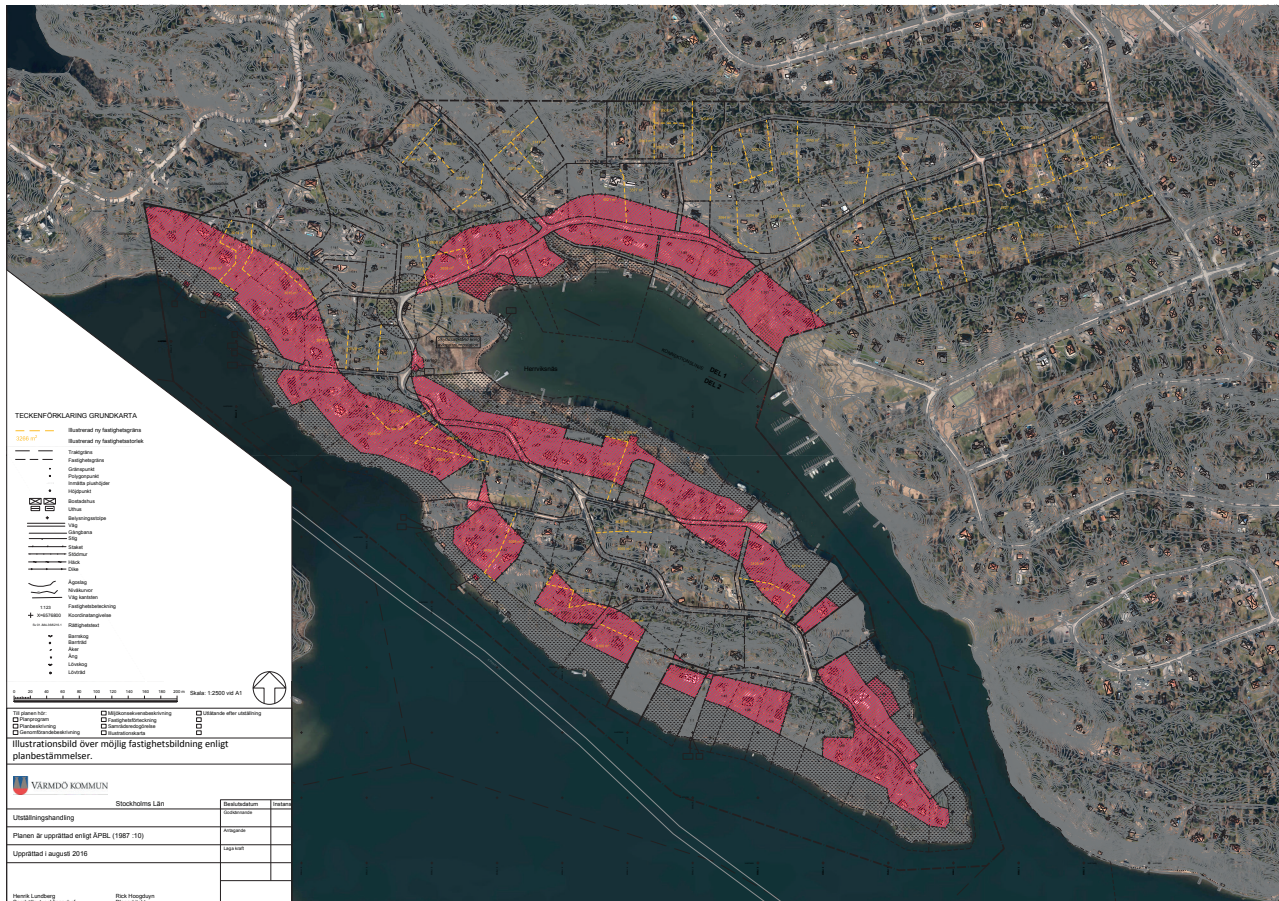
Möjlig ny fastighetsindelning (2016). Se bilaga Fastighetsindelning för större redovisning av fastigheter.

Marken är inte undersökt med avseende på radon. Av Boverkets byggregler framgår att byggnader ska uppföras radonsäkert om marken inte har undersökts. De enskilda fastighetsägarna ansvarar för eventuella geoteknikundersökningar (t ex bärighet av mark) som